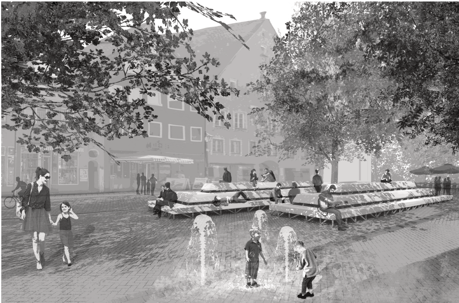
Blick auf das Bürgerforum und die Kramerzunft, Darstellung aus der Mehrfachbeauftragung

Gutenbergstraße 11 D - 85354 Freising fon + 49 (0)8161 / 86216-20 fax + 49 (0)8161 / 86 216-49 buero@grabner-huber-lipp.de www.grabner-huber-lipp.de