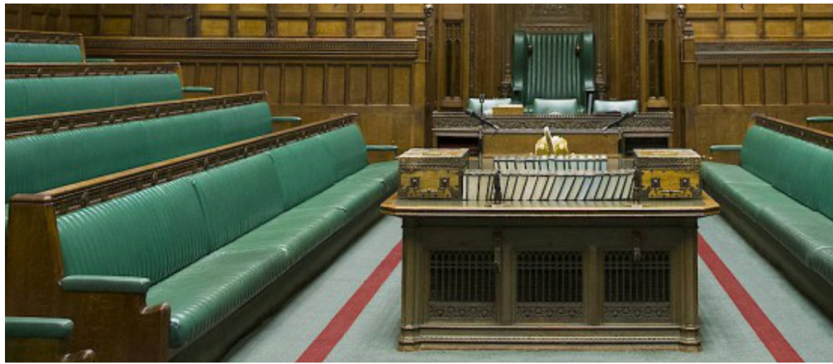
Orte der Demokratie - ein Gegenüber und Miteinander

Memmingen ist bekannt als Stadt der Freiheitsrechte bzw. der 12 Bauernartikel. Um dies in den Freiraum des Weinmarkts zu transportieren, soll das benutz- und besitzbare „Bürgerforum“ neben dem bestehenden Freiheitsbrunnen als zweiter Protagonist des Weinmarkts installiert werden. Dieses künstlerisch gestaltete Möbel befindet sich nicht nur gegenüber dem Gebäude der Kramerzunft und in einer Flucht mit dem Freiheitsbrunnen, sondern soll in seiner Gestaltung Teile der Ornamentik der Kramerzunft zitieren. Die Materialität spiegelt traditionelle Handwerkskunst wider und nimmt Bezug auf die Materialität der Kramerzunftstube