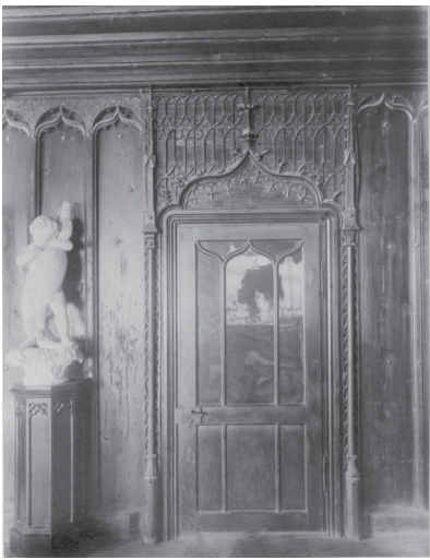
Innenraum der Kramerzunft